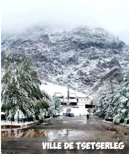
VILLE DE TSETSERLEG